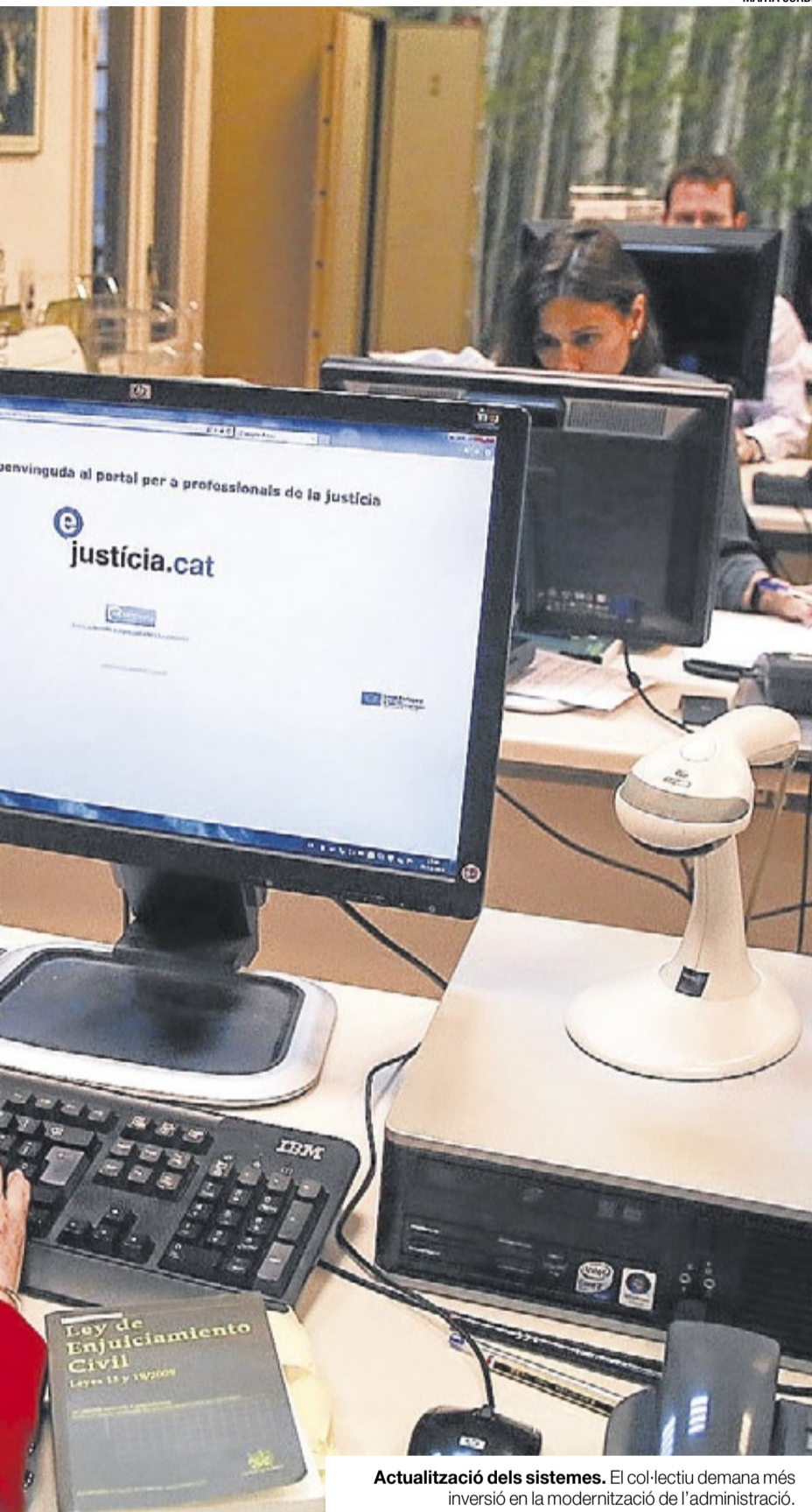
Actualització dels sistemes. El col·lectiu demana més inversió en la modernització de l'administració.

execució d'aquestes pràctiques. Per una banda, el col·lectiu proposa la posada en marxa d'una Oficina Mixta d'Execució, que reuniria recursos humans procedents de la procura i de l'oficina judicial dedicats a la resolució de determinats aspectes de l'execució de sentències de la manera més àgil possible. Per l'altra, el pla estratègic estableix la creació de l'Observatori de l'Execució Judicial de Catalunya, un òrgan que naixeria per aportar transparència a les execucions i per facilitar el bon govern. Aquest organisme avaluarà informes sobre la mesures necessàries per a la millora dels mecanismes i les normatives implicades.