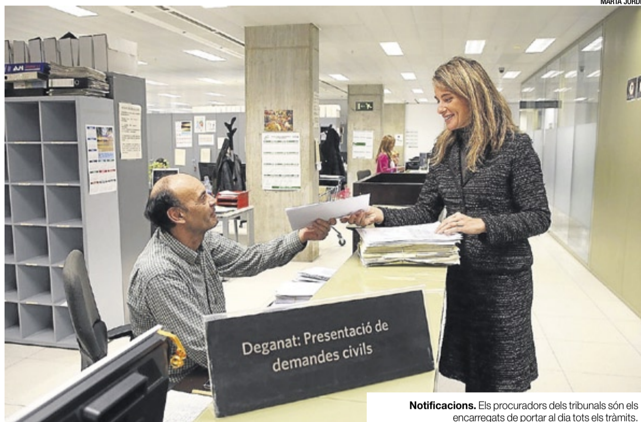
Notificacions. Els procuradors dels tribunals són els encarregats de portar al dia tots els tràmits.